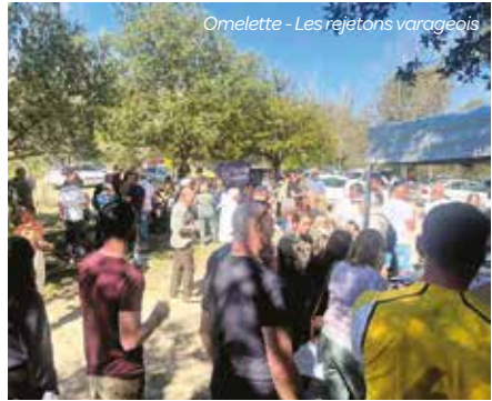
Omelette - Les rejetons varageois