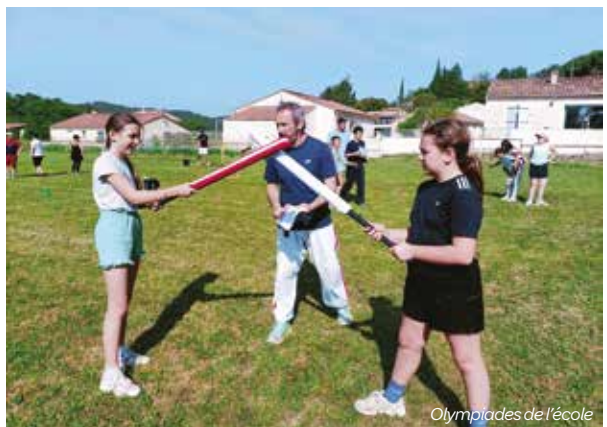
Olympiades de l'école