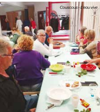
Couscous - L'eau vive