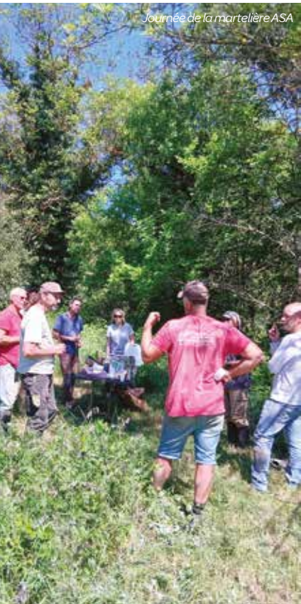
Journée de la martellière ASA