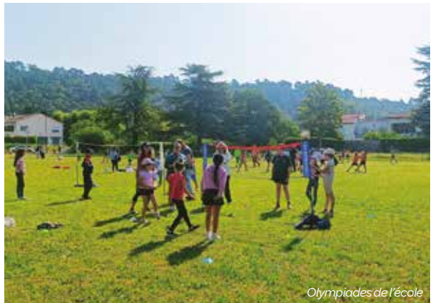
Olympiades de l'école