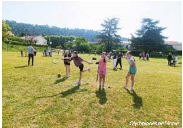
Olympiades de l'école