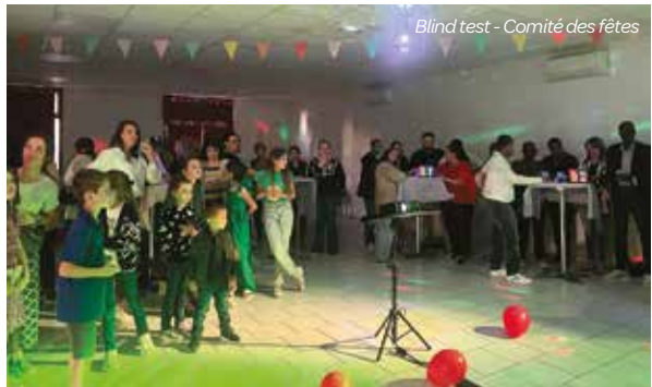
Blind test - Comité des fêtes