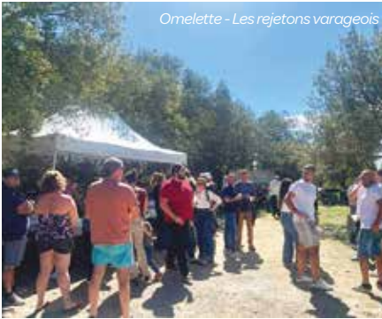
Omelette - Les rejetons varageois