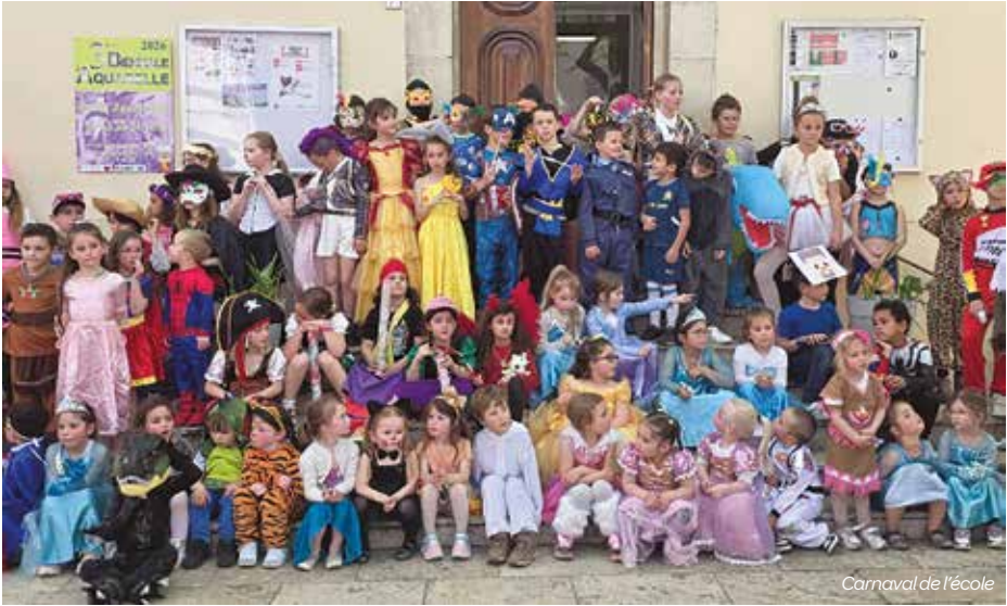
Camaval de l'école